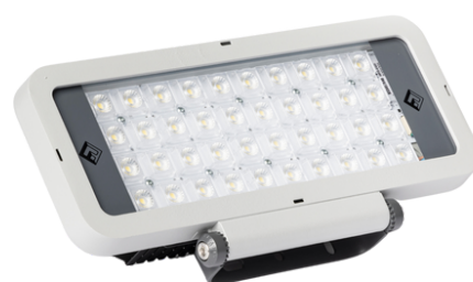
LZ 100 W