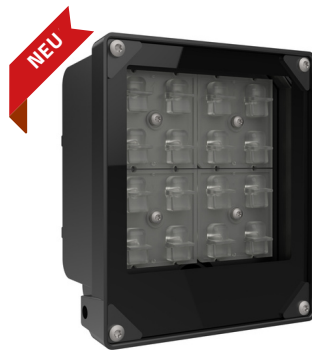
LZ 50 W

Die neueste Scheinwerferserie mit LED-Technologie sind die LZ-Scheinwerfer, die eine hervorragende energieeffizienter Leistung und großartiger Lichtleistung vereinen. Sie sind in den Ausführungen 50 W, 80 W, 100 W, 200 W, 300 W oder 400 W und mit 60° oder 90° Lichtkegel erhältlich.