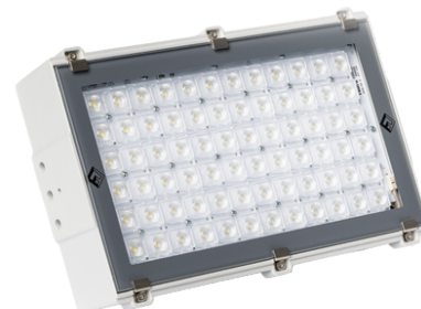
LZ 200 W